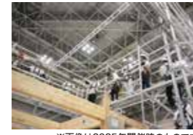
※画像は2025年開催時のものです。

展示会場で、住宅を実際に建て、実験する体験型企画。施工や実験をリアルタイムで行い、大工の手仕事や納まり、建材の性能や施工性まで、「絶対に見逃せない」ポイントを施工しながらその場で解説します。